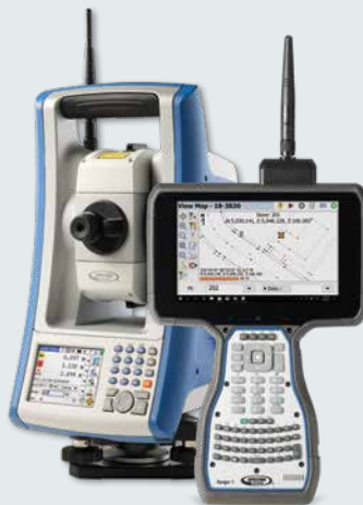
FOCUS 35 + Ranger 7

Spectra Precision GeoLock技术允许自动全站仪利用最初的GPS定位来辅助搜索一个光学目标的位置。随后,远程仪器通过GPS位置而能被直接引向自动移动的操作员,然后快速展开后续搜索,再次获得自动流动站的位置。该技术大大地减少了工时消耗,提高了您的外业工作效率。