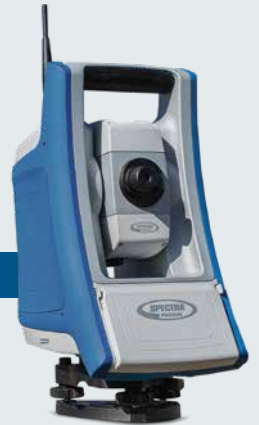
FOCUS 35 RX

全新FOCUS 35 RX 型号采用独特的双电池系统,提供12小时的超长操作时间,在一整天的工作中也无需停机以更换电池。